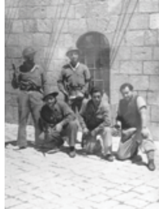
Վանքի պահակախումբը 1948 թ.