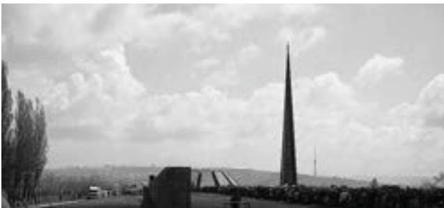
Ծիծեռնակաբերդ. Յուլարձան Եղեռնի գոհերին Երևանում