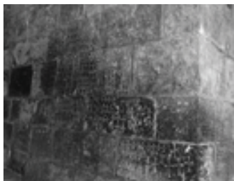
Սր. Գրիգոր Լուսատրիցի եկեղեցու պատը՝ խաչերով