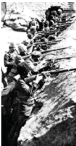
Վանի պաշպանությունը 1915 թ.