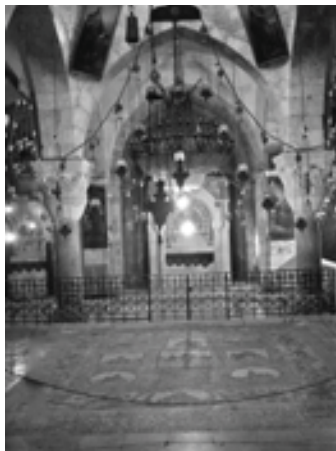
Սր. Գրիգոր Լուսատրիցի եկեղեցի