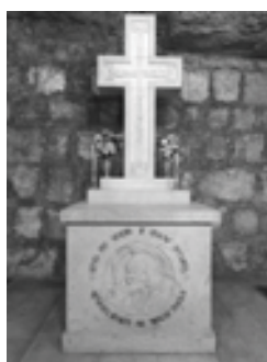
Սր. Վարդան եկեղեցի