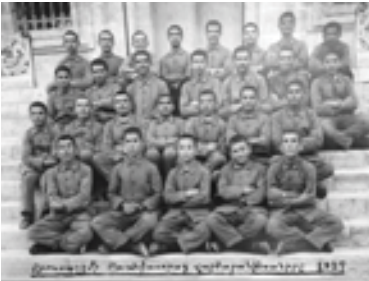
Վանեցի որբերը ճեմարանականների թում