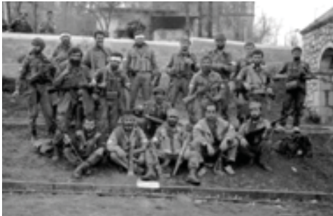
1992 թ. Մալխ. Ազատագրում Շուշի քաղաքը