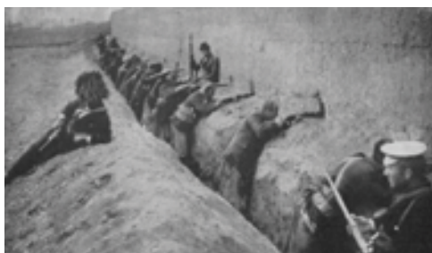
Վանի պաշպանությունը 1886 թ.