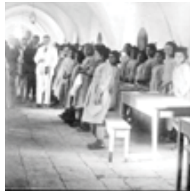
Վանեցի որբ աղջիկները