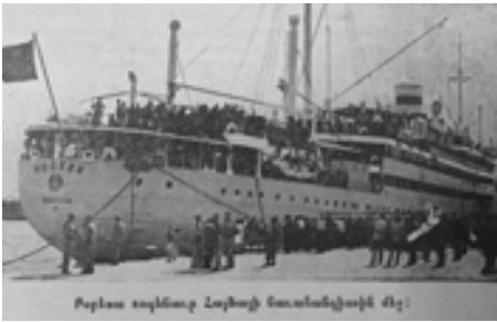
28 հոկտեմբեր 1947 թ. Նախապի նահանգապում «Պորեդա» շոգենար