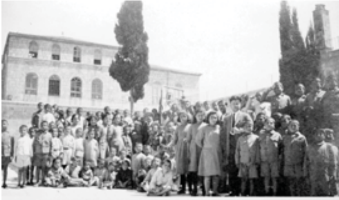
Վանեցի որբերը երուսաղէնում