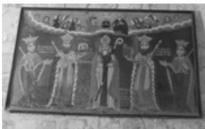
Սրբապարկեր՝ Սր. Գրիգոր Լուսատրիցի (կենտրոնում), Տրդատ և Աշխեն, Աբգար և Նեղինե (ձախից)