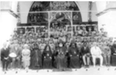
Վանեցի որբերի «Ճանֆար» փողային նուագախումբը