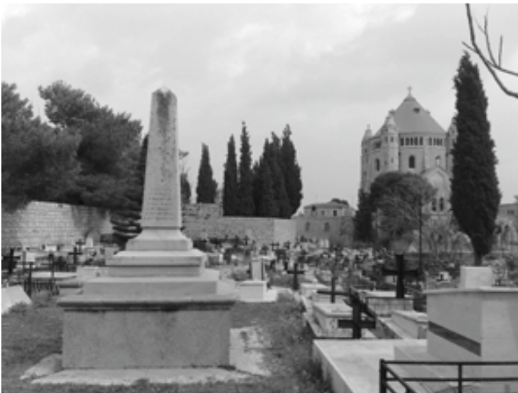
Վանեցի, Սերաստրացի, Մարաշցի, Ուրֆացի, Մալաթիացի, Ադանացի, Կեսարացի, Պոլսեցի, Խարբերդցի, Զեյթունցի, Կարսեցի, Էրզրումցի, Տիգրանակերտցի, Երուսաղեմցի...