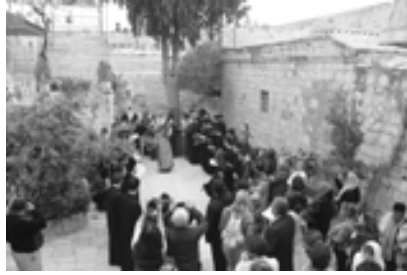
Թատիր Աագ Տինգաբոյի