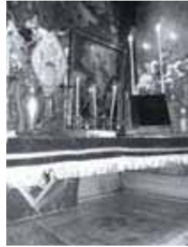
Զարկական Պատարագ Տիրոջ Գերեզմանին, Ապրիլ 24