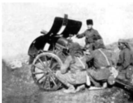
Վանի ռմբահարումը 1915 թ.