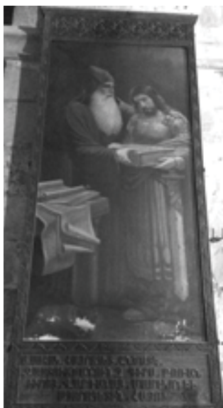
Սր. Մահակ Կաթողիկոս և թոռը՝ Սր. Վարդան Մամիկոնեան