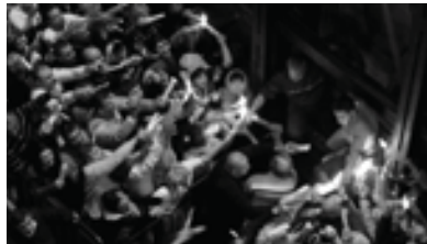
ԼՈՅՍ 2011 թ.